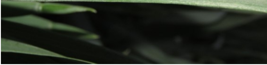
Foto 2. Hvedegalmyg på hvedeblad fotograferet 23. maj af Gitte Skovgaard Jensen, LMO.