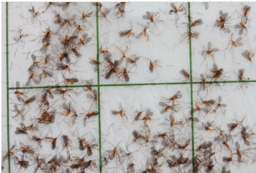
Foto 1. Limplade med mange hvedegalmyg fotograferet 27. maj 2018.